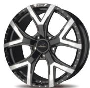
22inch 5H Black Clear

力強いセンタースポークからリムエンドへと分岐するドロップライン SUVをさらに存在感ある次元へ昇華させるプレミアムホイール