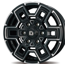
16inch SAND BLACK