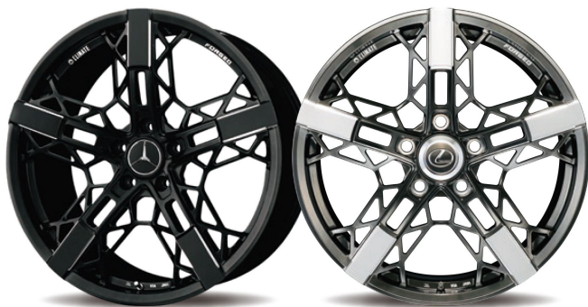
BM (Black Machining) CBM (Chrome Black Machining)