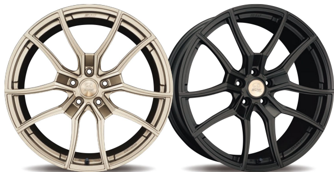
Shadow Bronze (全塗カラー) Graphite Black (全塗カラー)