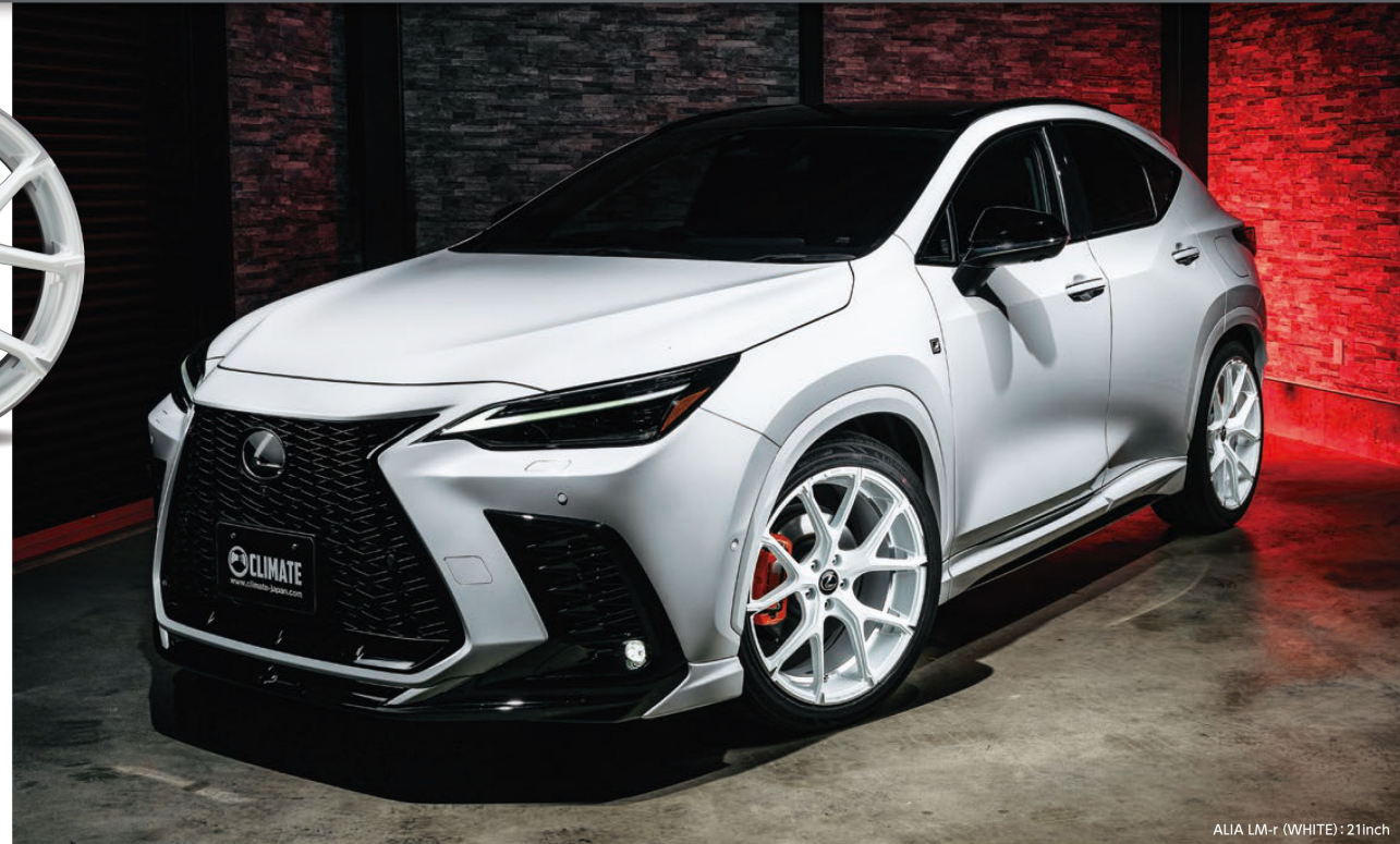
ALIA LM-r (WHITE): 21inch