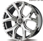
22inch 5H Super Chrome