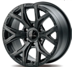
17inch 6H Mat Black (Limited Color)