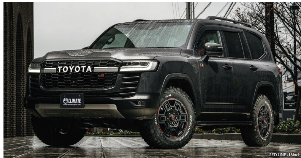
RED LINE - 18inch