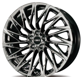
21inch 5H SBC