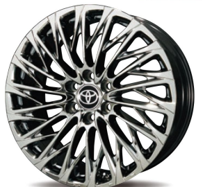
22inch 6H SBC