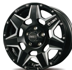
16inch 5H Mat Black Machining