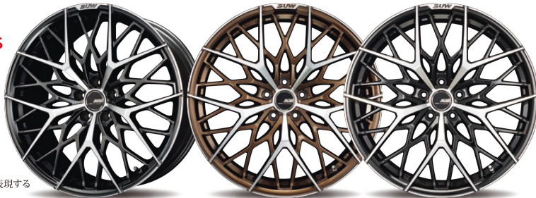
SBC/P (SBC Polish)

異なる造形のスポークを重ね合わせた ツインディスクデザイン コンケイブの裏に潜むスポークとの融合が表現する 異次元の立体感