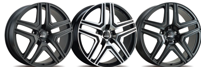
Shot Black Alumite Dia Cut Clear Black Alumite Clear

新しさとクラシックの融合 高いポテンシャルと高品質を兼ね備えた 最高級車への定番