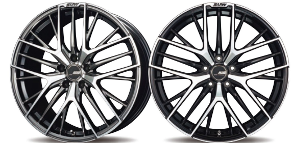
SBC/P (SBC Polish)

異なる造形のスポークを重ね合わせた ツインディスクデザイン コンケイブの裏に潜むスポークとの融合が表現する 異次元の立体感