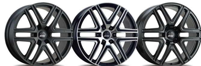
Shot Black Alumite Dia Cut Clear Black Alumite Clear

6本のスポークが指し示すディステーションは無量大 重量級クロカンSUVも支える強靭な性能