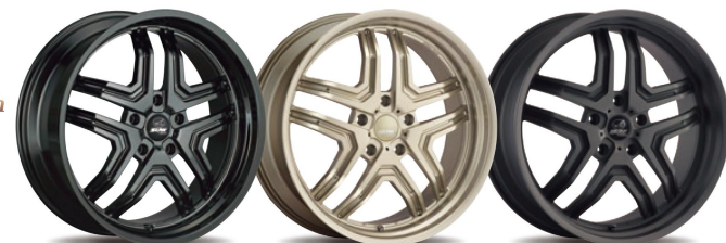
Piano Black White Gold Shot Black

最新の高剛性ボディを支える強さとともに サイズを超える圧倒的な軽さを併せ持つ希有な存在