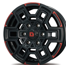
16inch RED LINE