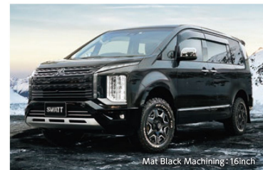
Mat Black Machining・16inch